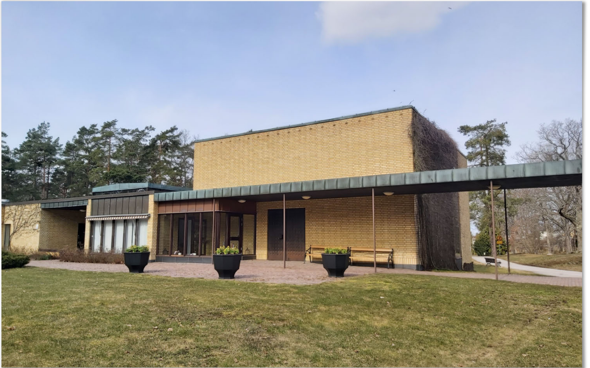
Skogskapellet, Oskashamn 5 april 2023