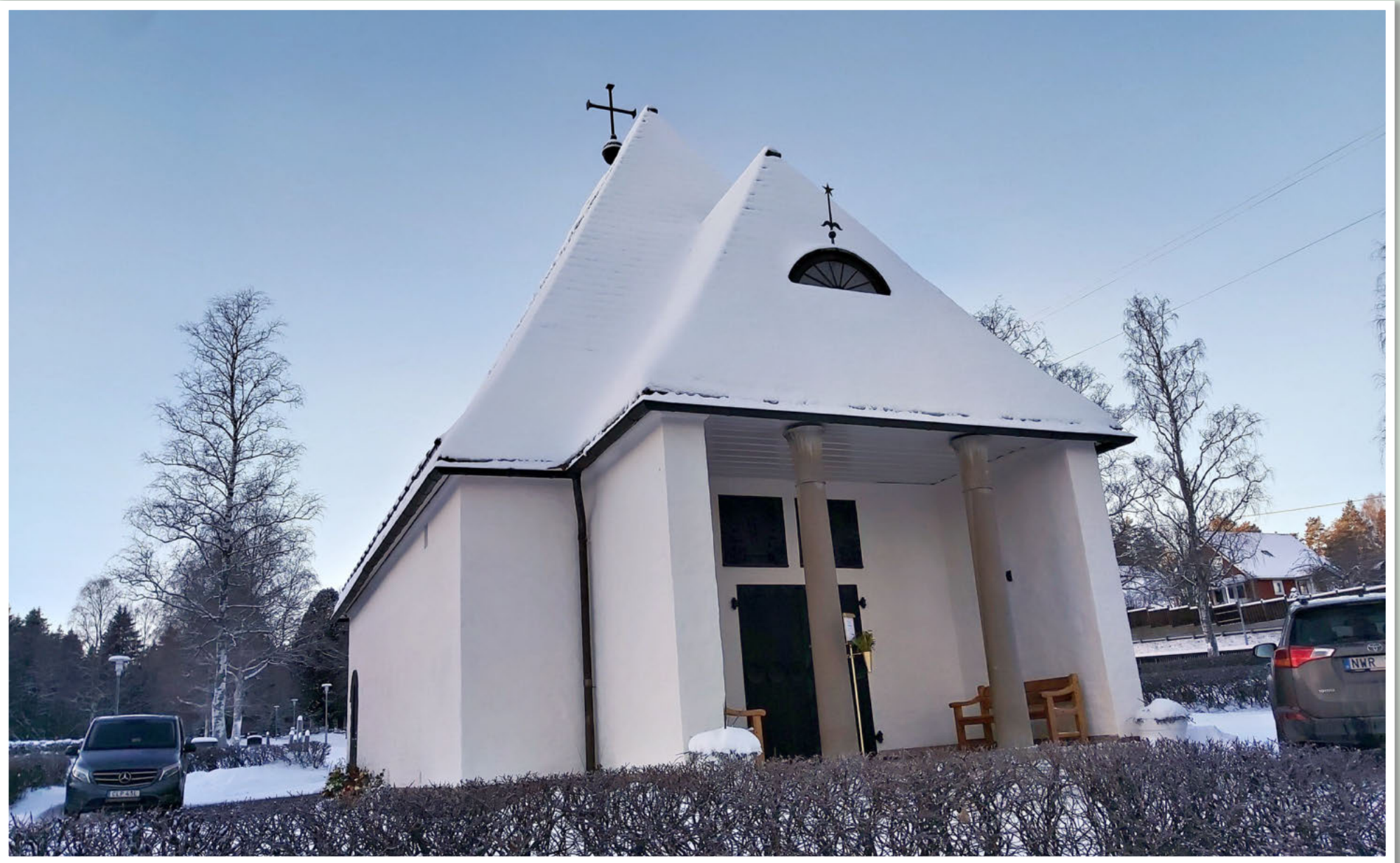
Bydalens gravkapell torsdag 22 december 2022