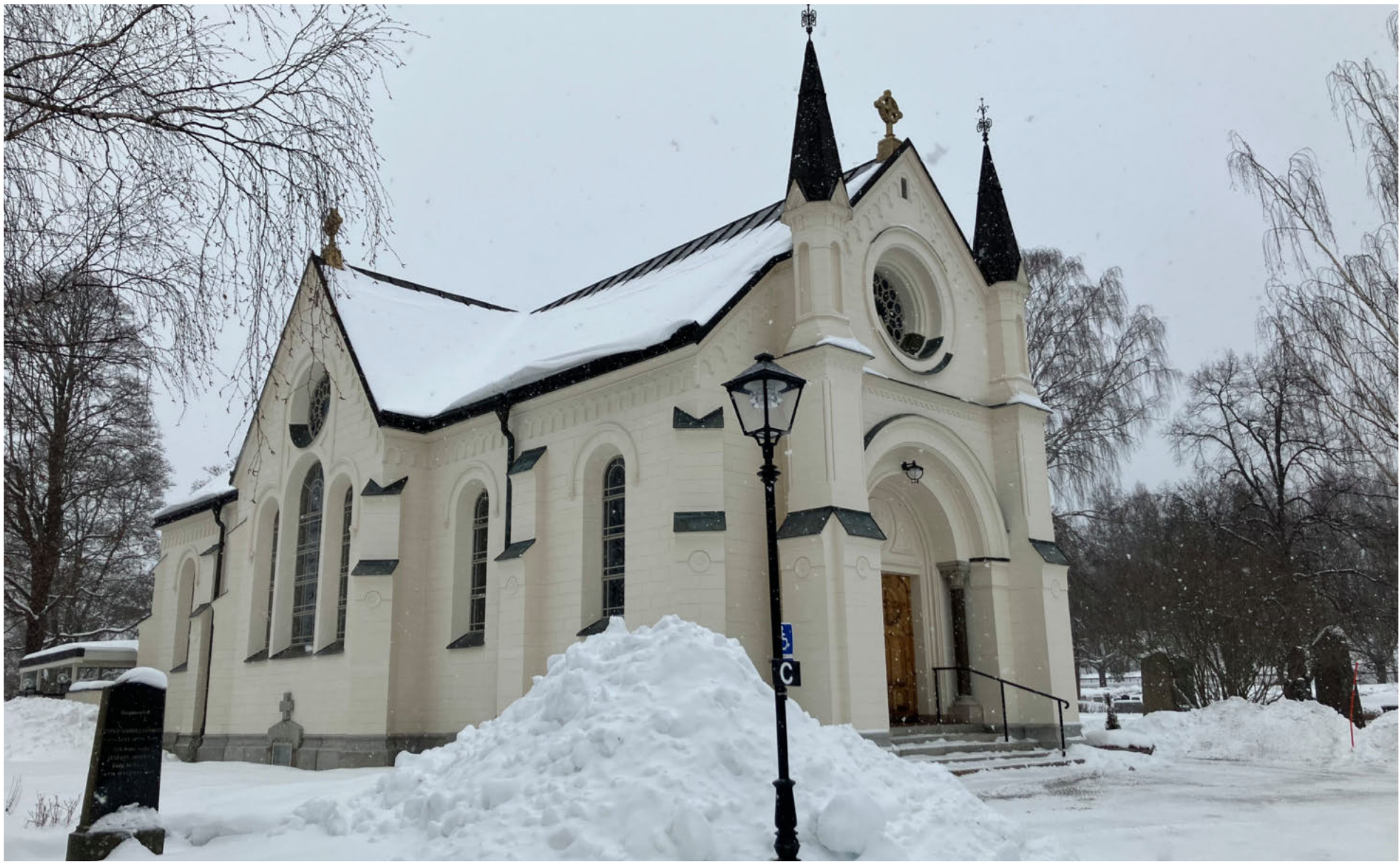
Gustav Adolfs gravkapell Fredag 24 februari 2023