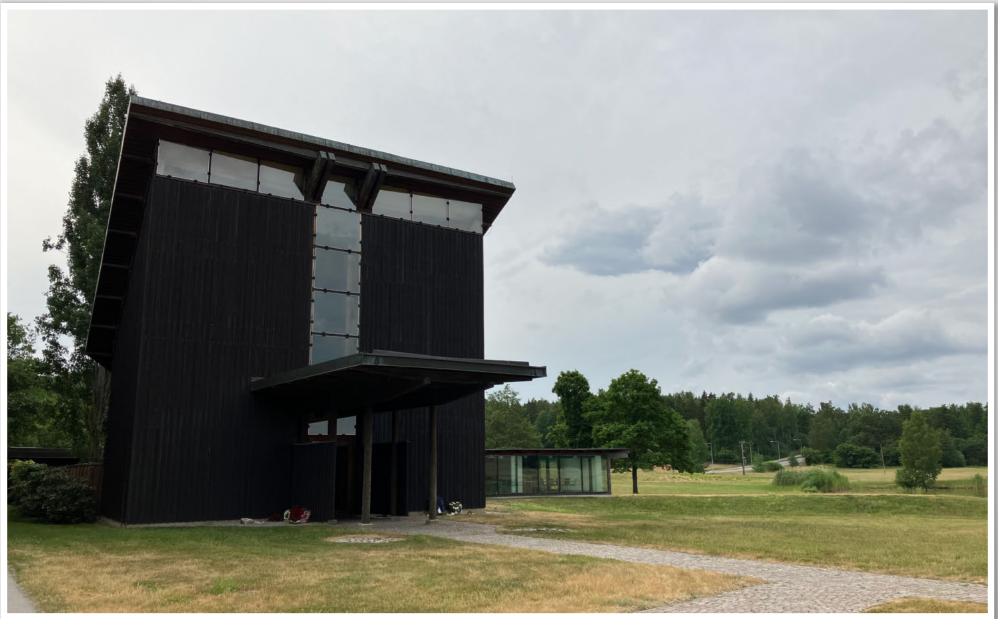
Pilgrimskapellet fredagen den 30 juni 2023